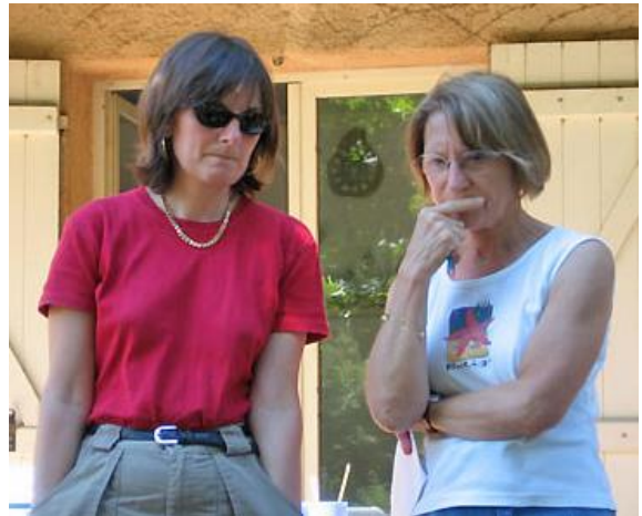
Deux expertes de 1, 2, 3, sciences en pleine réflexion...

rouge qui se dirige tranquillement de la porte vers le centre de la pièce devant nos regards remplis de gratitude.